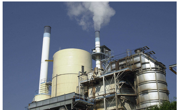
SIAP – Bassens (33)

➤ L'évapo-incinération : destinée au traitement des fluides usagés (huiles solubles, synthétiques ...). Le principe consiste à séparer par évaporation une fraction gazeuse (vapeur d'eau et composés organiques volatils) d'une fraction liquide concentrée. La fraction gazeuse est incinérée à haute température dans un four spécifique et la fraction liquide est incinérée avec les autres déchets dangereux dans le four classique (850 ou 1100°C).