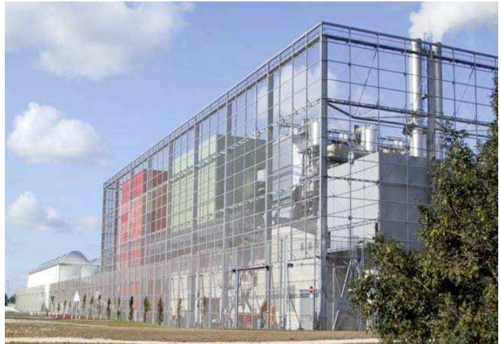
Astria – Bègles (33)

➤ ASTRIA à Bègles qui produit 140 millions de kWh d'électricité par an. Traitement : 273 000 tonnes / an de déchets.