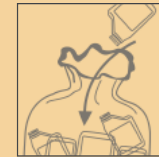
mettre en sac (Facultatif)