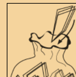
mettre en sac

Vider les eaux de rinçage dans le pulvérisateur