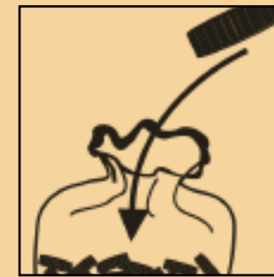
rassembler les bouchons