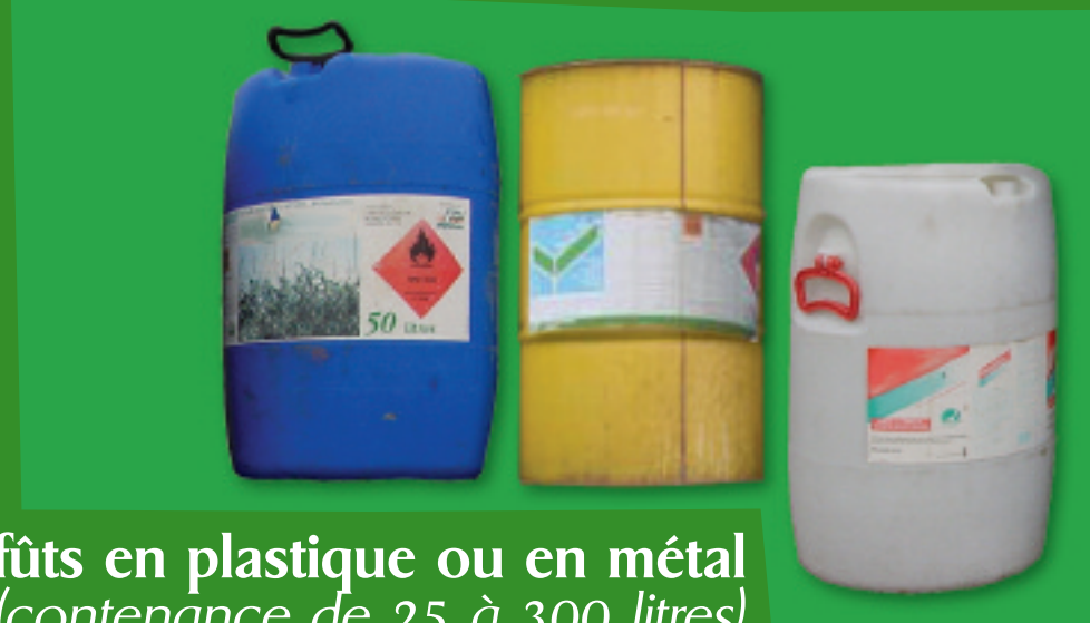
fûts en plastique ou en métal (contenance de 25 à 300 litres)