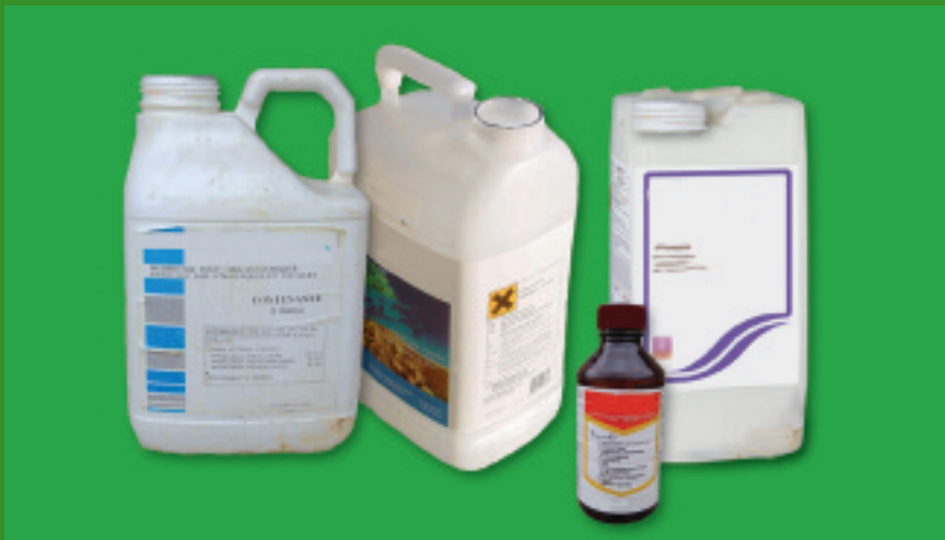
bidons en plastique (contenance inférieure ou égale à 25 litres)