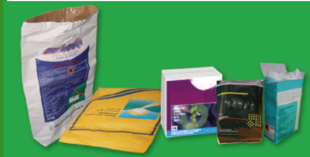
sacs et boîtes en carton, papier, plastique... (contenance inférieure ou égale à 25 kg)